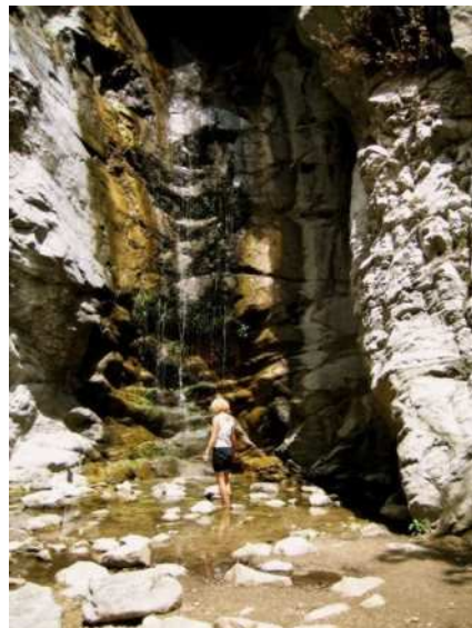
La cascade du Millard Canyon

Les terres qui par la suite se sont appelées Altadena étaient à l'origine le pays des Indiens américains de la tribu des Gabrielinos. Cette tribu était composée de plusieurs communautés différentes, qui ont malheureusement perdu leur individualité avec l'arrivée des explorateurs espagnols. Les Gabrielinos formaient des sociétés complexes qui avaient appris à vivre au cœur des paysages qui composent les parties basses des montagnes de San Gabriel et à se servir des plantes de ces montagnes. Le style de vie de ces Indiens américains a cependant changé radicalement avec l'arrivée des explorateurs espagnols. Les Indiens Gabrielinos ont été forcés de vivre selon les caprices des Espagnols. Des missions ont été établies en Californie par les Espagnols, et la plupart des peuples indiens ont été forcés de travailler avec eux. Pour cette raison, les cultures des sociétés des Gabrielinos se sont lentement perdues. □