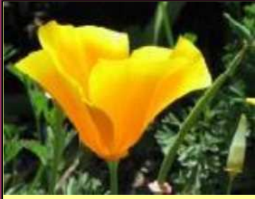
Le pavot de Californie