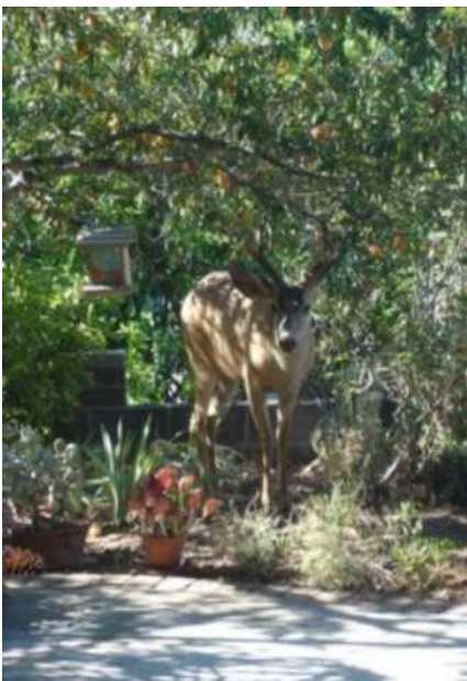
Discret, l'amateur d'oranges...