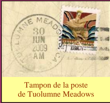
Tampon de la poste de Tuolumne Meadows