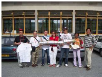
La fusée, sous toutes ses formes, est un vecteur privilégié pour développer les liens entre La Réunion et Gifu.

Fusées à eau et clubs spatiaux, fusées expérimentales et quasi-satellites pour des opérations conjointes entre jeunes de nos deux régions, les activités éducatives spatiales sont au cœur des rencontres entre La Réunion et Gifu.